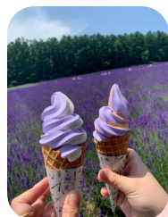
↑北海道のラベンダーソフト

まだまだ不慣れな部分も多く、ご迷惑をおかけするかと思いますが、皆さんと笑顔で過ごせる時間が増えるよう、頑張っていきますのでよろしくお願いします。