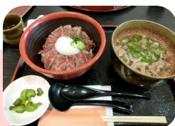
熊本の→あか牛丼と肉吸いセット