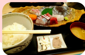
←博多駅のお刺身定食